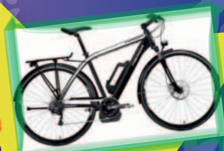
Valeur de 3490.-

Concours roue de la chance Concours vélo électrique Merida pour homme heure du tirage au sort : 16h00