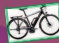
vélo électrique Merida pour homme Valeur de 3490.-