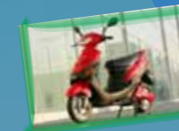
Scooter électrique GT 1500 (rouge) Valeur de 3990.-