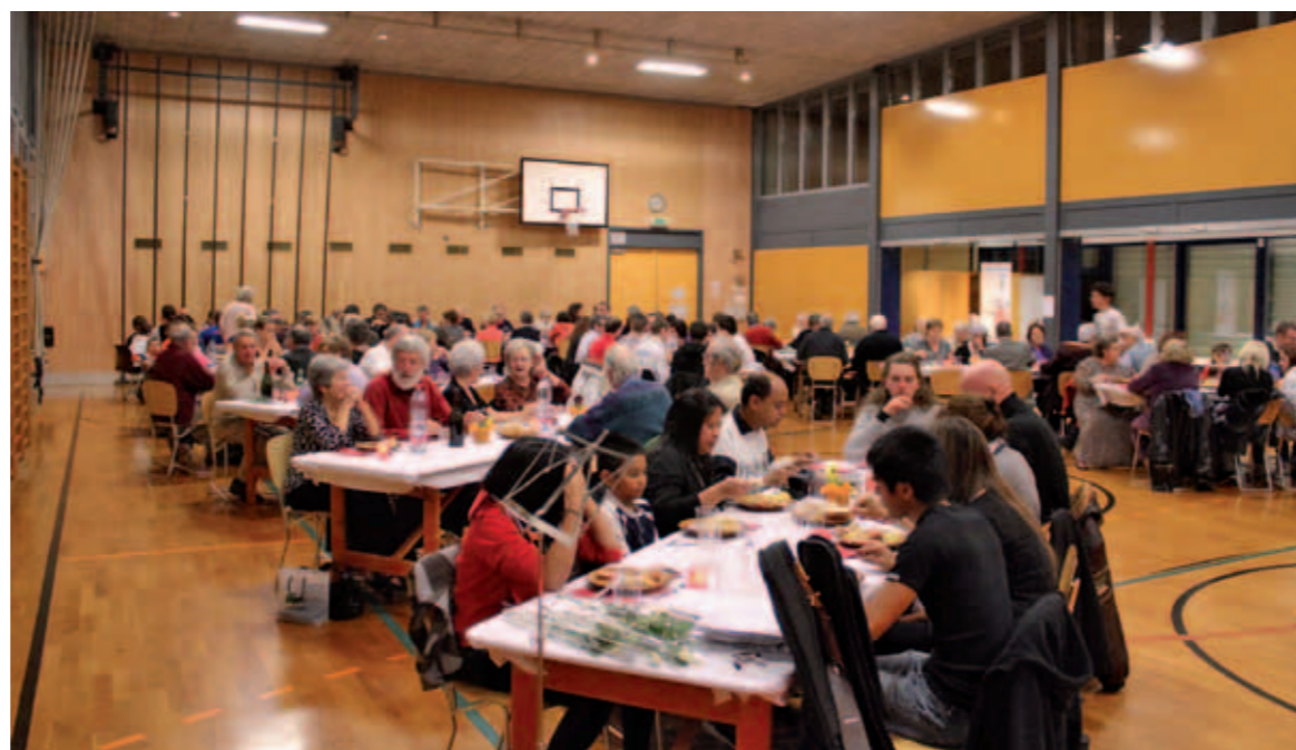
Soirée automnale. Une ambiance sympathique et conviviale

Malheureusement, en 1999, vu la difficulté, voire l'impossibilité de renouveler les effectifs, la dissolution de ce sympathique groupe de musique champêtre est donc décidée, après 71 ans d'animation musicale aussi bien dans notre région que hors les murs.