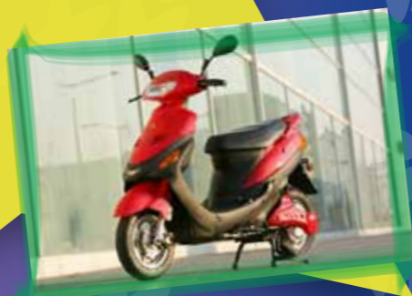
Valeur de 3990.-

Concours roue de la chance Scooter électrique GT 1500 (rouge) heure du tirage au sort : 16h00