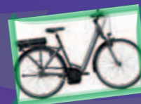
vélo électrique Merida pour dame Valeur de 2990.-