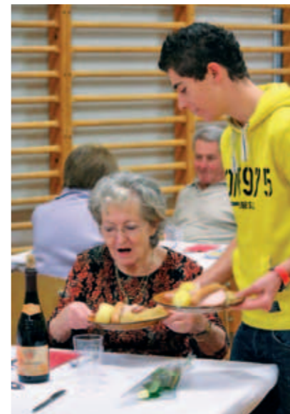
Ambiance lors de la soirée automnale