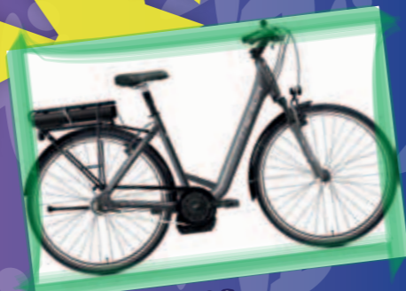
Valeur de 2990.-

Concours de déguisements pour l'Escalade 2 catégories Concours vélo électrique Merida pour dame heure du tirage au sort : 16h00